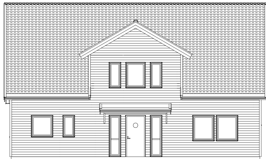
FASAD MOT B